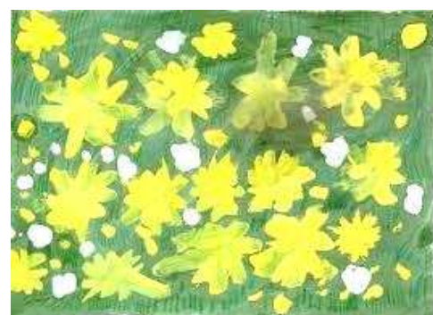
Рисунки наших юных художников